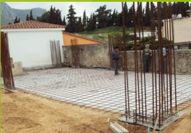
Κάτω πλάκα – 25n EBA