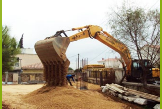
Επίχρωμα θεμελίων – 25n EBA