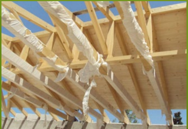
Κατασκευή οροφής - 25η ΕΒΑ