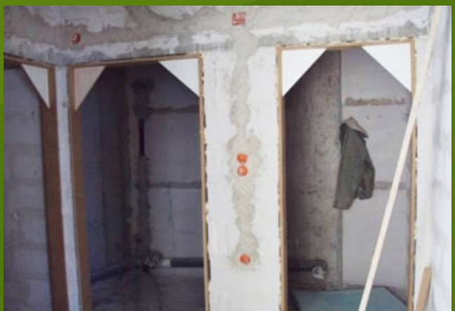
Η/Μ Εγκαταστάσεις - 1η φάση _ ισόγειο - 25η ΕΒΑ