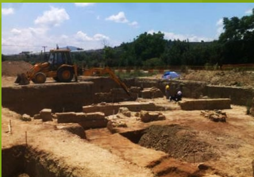
ΣΙΚΥΩΝΑ (ΜΟΥΛΚΙ), Χ.Θ. 17+100, τμ. ΚΟ-ΠΑ Ανασκαφή σε αρχιτεκτονικά κατάλοιπα