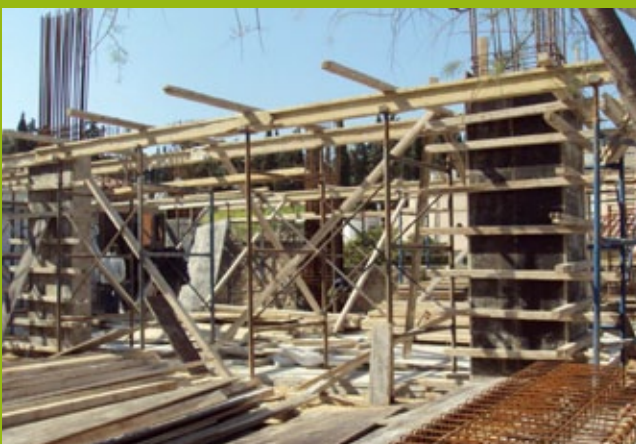
Πυλώνες ισογείου – 25n EBA