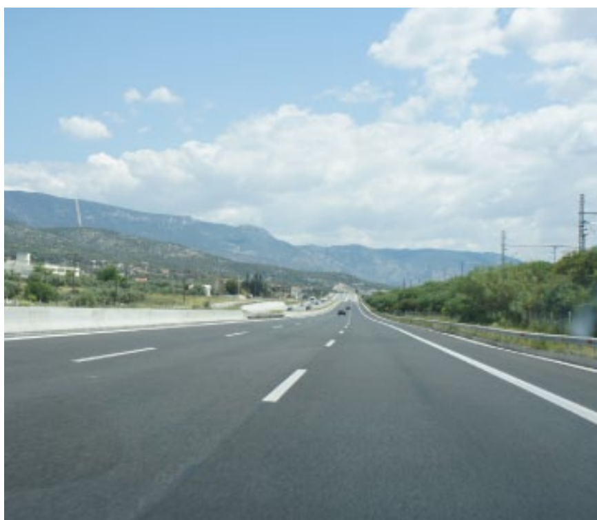
Άποψη από το τμήμα Ελευσίνα-Κόρινθος

Το προσωπικό του Λειτουργού του αυτοκινητοδρόμου και οι αρμόδιοι υπεργολάβοι πραγματοποίησαν τακτικές εργασίες κλαδέματος, βοτανισμού και καθαρισμού στο μεγαλύτερο τμήμα του έργου, και ειδικότερα σε 97 χλμ. κεντρικής νησίδας, σε 402 χλμ. ερεισμάτων και των 28 κόμβων και των κλάδων τους, όπως και στους 45 χώρους στάθμευσης.