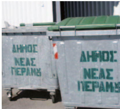
ΚΕΣ Νέας Περάμου

Για την διαχείριση των υδάτων έχει συνταχθεί κατάλληλη «Διαδικασία Διαχείρισης Υδάτων» στην οποία παρουσιάζονται αναλυτικά όλες οι ενέργειες από πλευράς