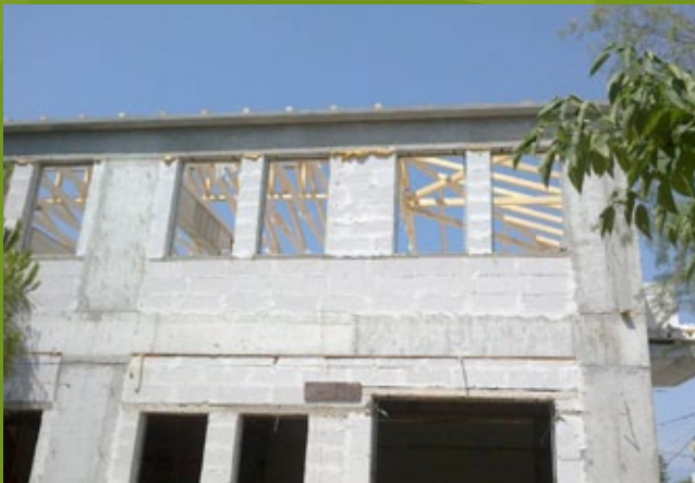
Κατασκευή οροφής - 25η ΕΒΑ