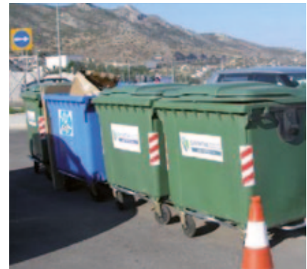
ΚΕΣ Νέας Περάμου