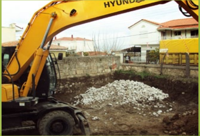
Στρώση εξυγίανσης – 25η ΕΒΑ