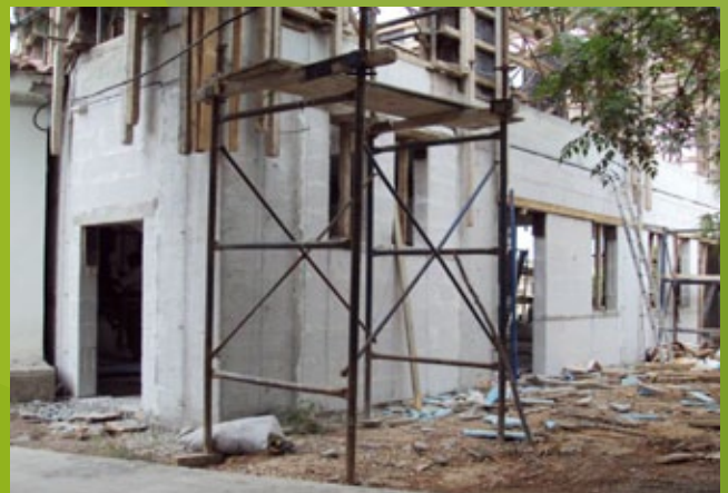
Εξωτερική τοιχοποιία - ισόγειο – 25η ΕΒΑ