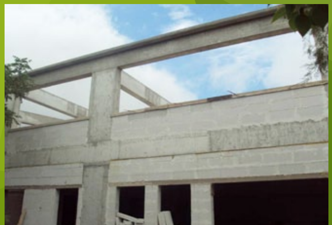
Εξωτερική τοιχοποιία - πρώτος όροφος – 25η ΕΒΑ