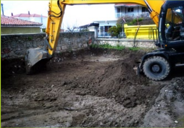
Εκσκαφή θεμελίων – 25η ΕΒΑ