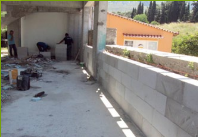
Εξωτερική τοιχοποιία - ισόγειο - 25n ΕΒΑ