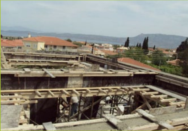
Σκυροδέτηση πυλώνων και δοκών 1ου ορόφου – 25η ΕΒΑ