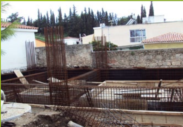
Σιδηροπλισμός θεμελίων – 25η ΕΒΑ