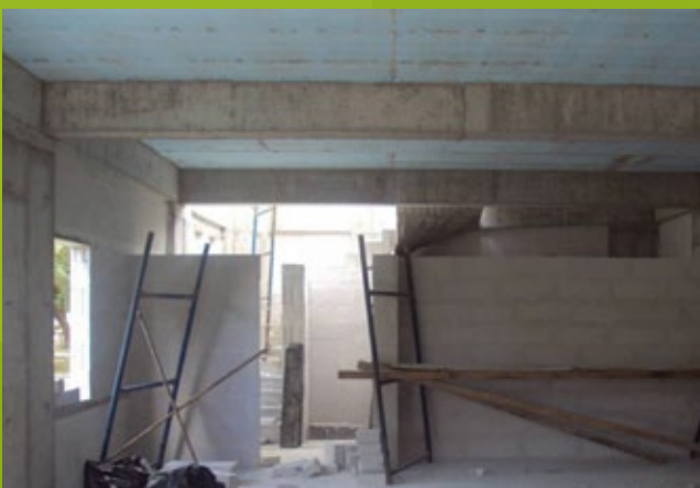
Εσωτερική τοιχοποιία - ισόγειο floor – 25η ΕΒΑ