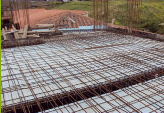
Σιδηροπλισμός άνω πλάκας - ισόγειο- 25n ΕΒΑ