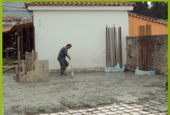
Κάτω πλάκα – 25n EBA