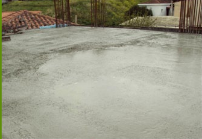
Σκυροδέτηση άνω πλάκας - ισόγειο- 25n ΕΒΑ