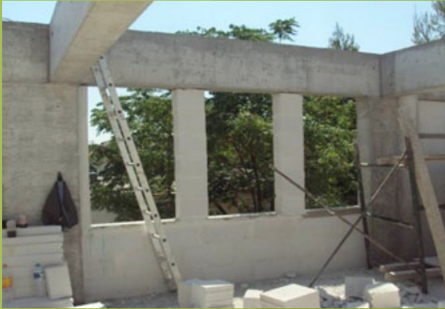
Εξωτερική τοιχοποιία - πρώτος όροφος - 25η ΕΒΑ