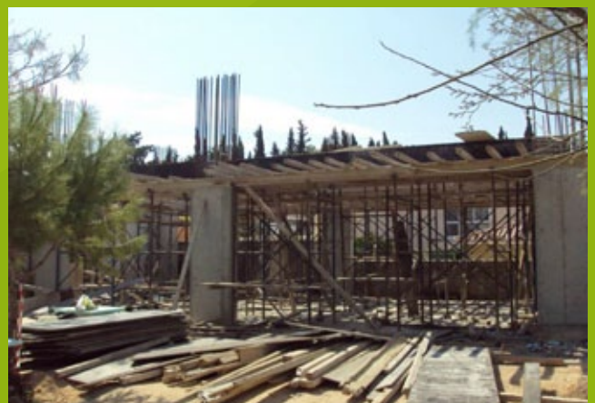
Άνω πλάκα ισογείου – 25n EBA