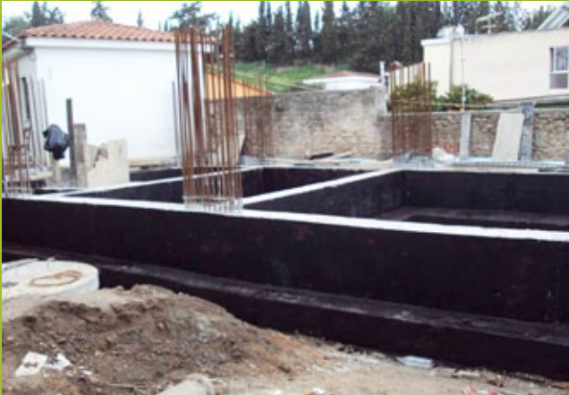
Ασφαλτική επάλειψη – 25n EBA