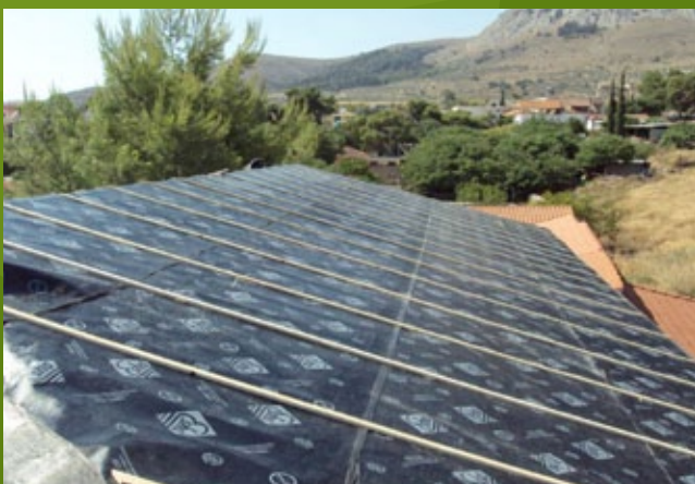
Κατασκευή οροφής - 25η ΕΒΑ