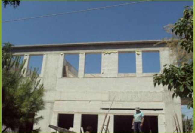
Εξωτερική τοιχοποιία - πρώτος όροφος - 25η ΕΒΑ