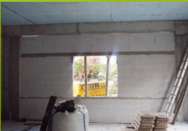
Εξωτερική τοιχοποιία - ισόγειο – 25η ΕΒΑ