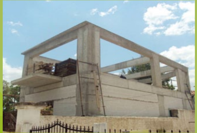
Πυλώνες και δοκοί 1ου ορόφου – 25η ΕΒΑ